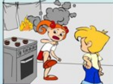
Неправильне користування газом та електроплитами