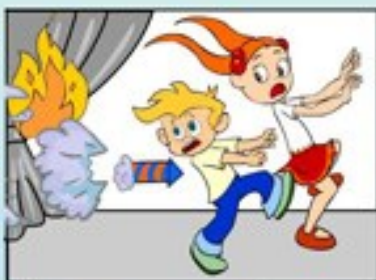
Фесрверки в приміщеннях