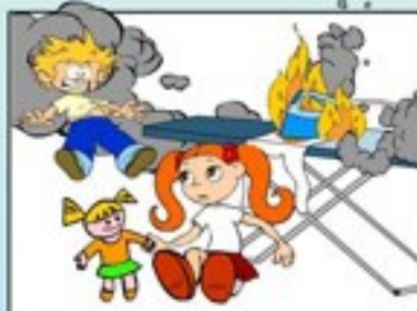
Залишені увімкненими електроприлади