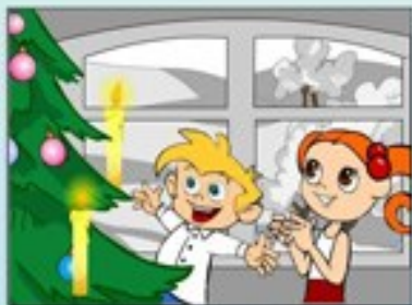
Ігри з вогнем