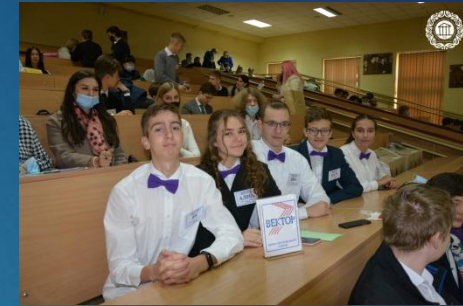
Збірна команда Московського району «Вектор»