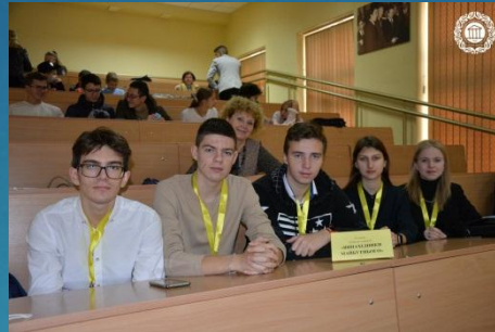
Збірна команда Київського району «Винахідники майбутнього»