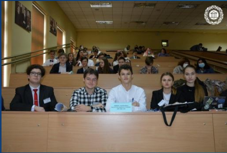
Збірна команда Індустріального району «Пультар»