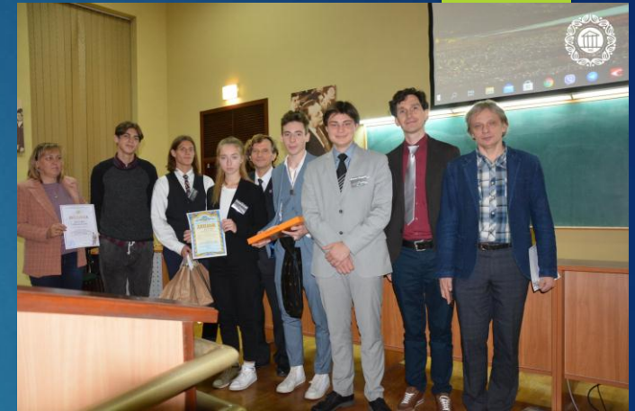
II місце - збірна команда Шевченківського району «Спектр»