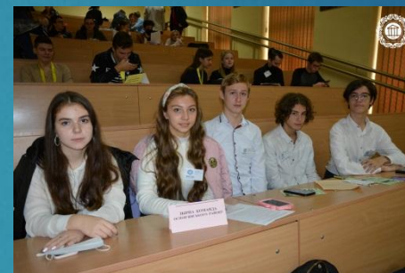
Збірна команда Оснóв'янського району