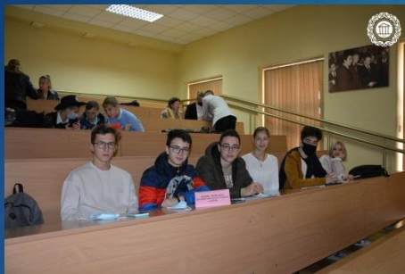
Збірна команда Немишлянського району «Атом»