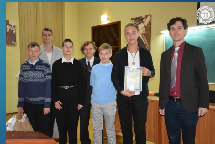
III місце - команда Харківської гімназії № 47 «Харків -47»