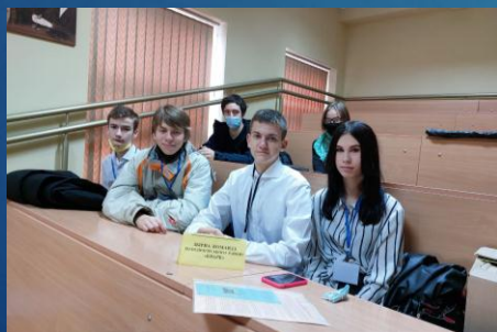
Збірна команда Холодногірського району «Кварк»