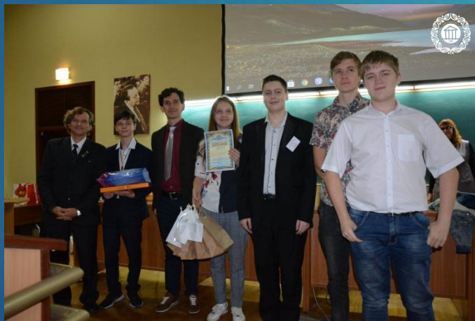
III місце - збірна команда Новобаварського району «Еніґма»