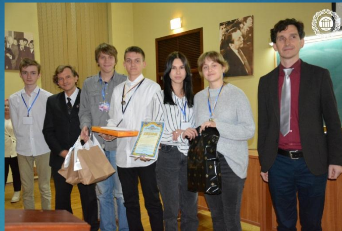
II місце - збірна команда Холоднірського району «Кварк»