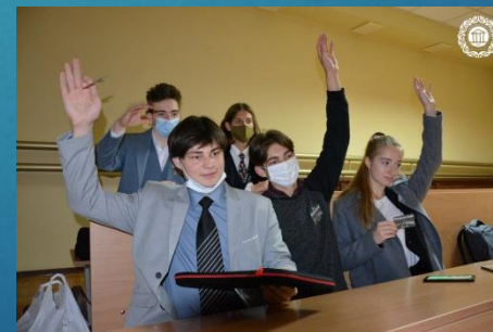
Збірна команда Шевченківського району «Спектр»