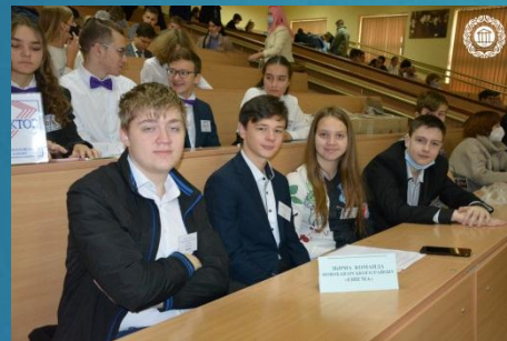
Збірна команда Новобаварського району «Енігма»