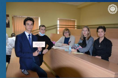
Збірна команда Слобідського району «IMPERIUM»