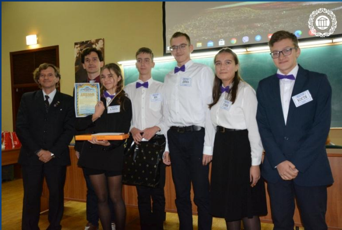
II місце - збірна команда Московського району «Вектор»