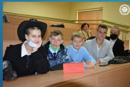
Команда Харківської гімназії № 47 «Харків - 47» Шевченківського району