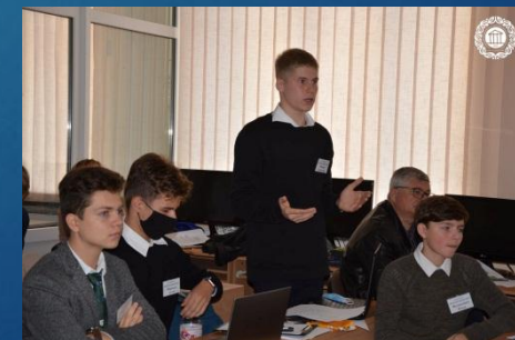
Команда Харківської гімназії № 116 «Сяйво» Шевченківського району